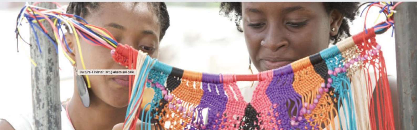
Culture à Porter: artigianato solidale

Pagina iniziale » MERCATO » Curiosità » Culture à Porter: artigianato solidale